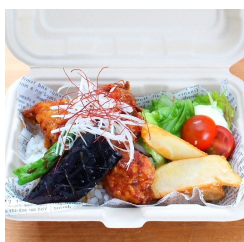
から揚げ 黒酢ソース弁当 750円（税込み）

お子さまでも大人気！ ロコモコがお弁当に 新登場★ 肉にコダワった 手ごねハンバーグに オリジナルデミソースと 目玉焼き。