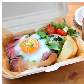
ローストビーフ弁当 730円（税込み）

お待たせいたしました！ 「森の姫牛」を使ったお姫様 ローストビーフがついに登場！ あまい脂が自慢の「森の姫牛」 をぜひご自宅でも！オリジナル ソースにからめてお召しあがり ください。