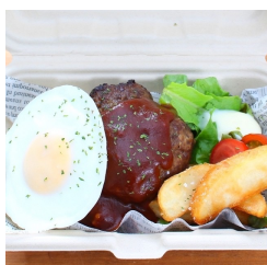
ロコモコ弁当 780円（税込み）

+120円（税込み）で 出汁にこだわった ホッカホッカのおみそ汁を セットにできます。