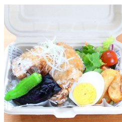
豚角煮 から揚げ弁当 780円（税込み）

当店自慢の特製ダレに 漬け込んだ ジューシーな唐揚げと 女性に人気の黒酢を あわせ、絶妙な味わいに 仕上げたお弁当。