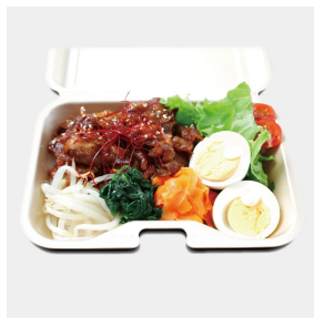
牛ビビンパ弁当 840円（税込み）

低温調理でじっくりと火を入 れた自家製ローストビーフをたっ ぷり盛り付け、温玉とカイワレ をのせました。オリジナルソー スをからめてお召し上がりくだ さい。