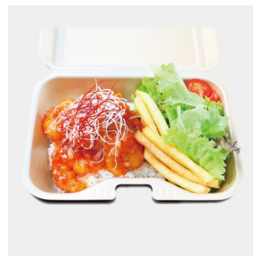
エビチリ弁当 840円（税込み）