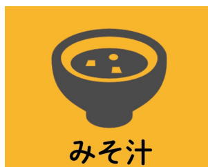
みそ汁をセットに

+120円（税込み）で 出汁にこだわった ホッカホッカのおみそ汁を セットにできます。