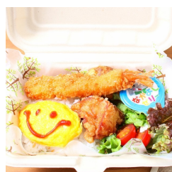
お子様弁当 650円（税込み）

仕込みに手間の込んだ 豚の角煮を 惜しみもなく唐揚げに！ 一度食べたらクセになる こと間違いなし！ の自信作です。